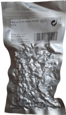
Hopfenpellets in vorbildlicher Verpackung.

Hopfenpellets sind vakuumiert verpackt in der Gefriertruhe jahrelang haltbar. Da sie auch sehr einfach zu dosieren sind, verwenden praktisch alle Hobbybrauer Hopfenpellets, viele ausschließlich.